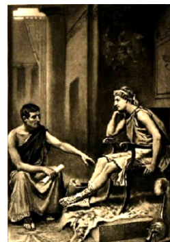
亞里士多德在教导亚历山大